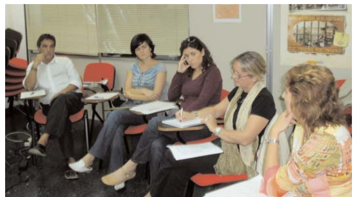
Reunión de la Comisión de Asistencia de UNAD

Por otra parte, la Comisión de Asistencia de UNAD está