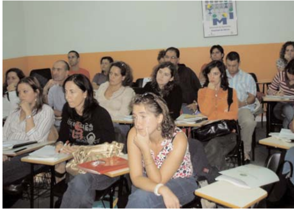
Asistentes al curso de Escuela de Salud de UNAD

de la Escuela de Salud cuenta con financiación del Ministerio de Sanidad y Consumo, a través del Plan Nacional sobre el SIDA.