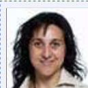
Eva del Amo Redacción Aprendemas 12/11/2009

Más del 22% de los alumnos de Primaria dice haber probado el alcohol y un 80% de los padres habla con sus hijos sobre drogas, según un estudio realizado por la UNAD para el Defensor del Menor.